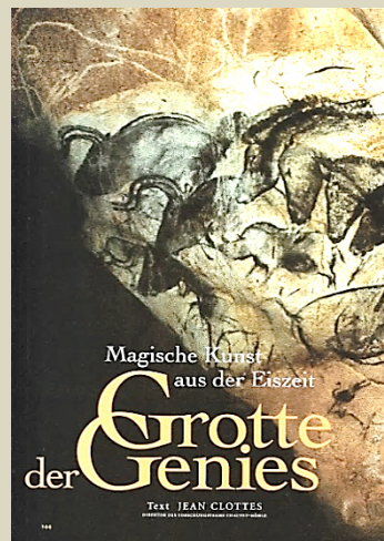
National Geographic-Heft 8/2001

Die Entdeckung der einzigartigen Grotte Chauvet im Jahr 1994 löste großes Erstaunen aus. Bis 36 000 Jahre vor unserer Zeit lassen sich die mehrfarbigen Wandgemälde dieser Höhle zurückdatieren. Sie zeigen vollendete Vielgestaltigkeit und Ausdruckskraft bereits in den frühesten magischen Bild-Erzählungen unserer VorfahrInnen. Die bisherigen Vorstellungen über die Entstehung von Kunst mussten revidiert werden.